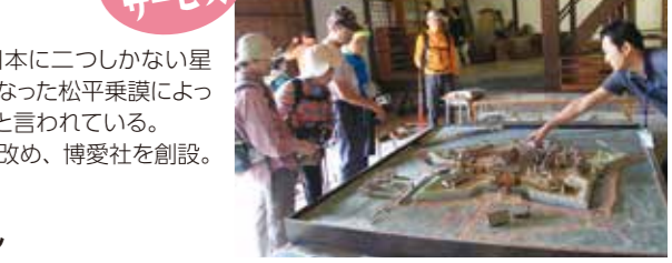
龍岡城五稜郭の資料が展示されている、お茶のサービス。