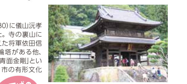
龍岡城の歴史解説